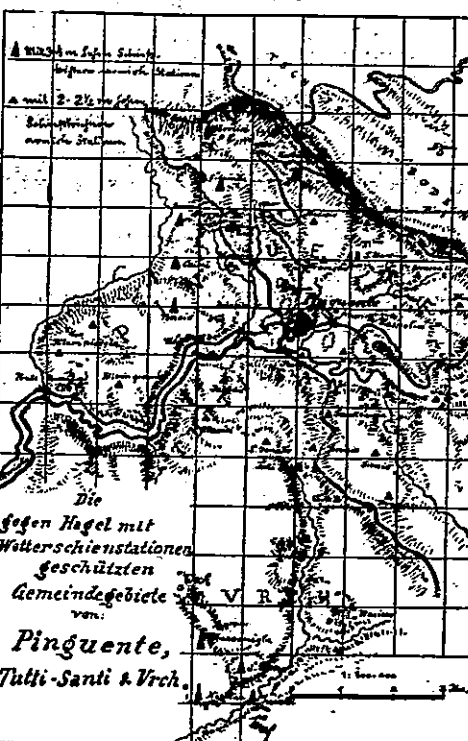
Namještaj tučobrana u obćinah Buzet, Svi Sveti i Vrh u godini 1900.

O naših strielnih postajah pisao je pohvalno list „Weinlaube“, što se tiska u Klosterneuburgu, koji je dobio i skicu topografskog namještaja istih. Tako se je izrazilo pohvalno i zemaljsko gospodarsko višće u svojem izvješću za lanjski godinu, te je i dalo preiskati onu skicu iz lista „Weinlaube“. Uslužnoću uredništva istoga lista možemo ju i mi ovdje ponatisnuti.