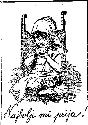
Najbolje mi prija!