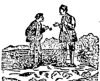
Franina i Jurina

Njemačka: Afrikanci zamrđaji zadaju njemačkoj diplomaciji ozbiljne skrbi, jer bi se iz ovoga mogao izloži njemačko-anglozki sukob. Englezi, koje je Njemačka pozvala, da sporazumno s njom postupaju u Zanabiru, odgovorili su, da su ta stvar njih netiče, jer da su ustanku krivi njemački agenti, koji da svoju surovu čud svagdje pokazuju.