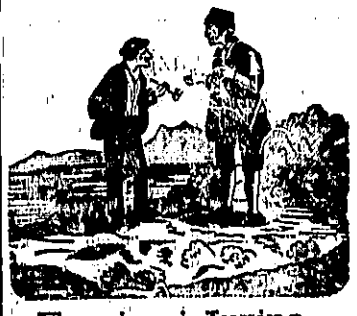
Franina i Jurina.