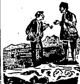
Frana i Jurina.

Englezkomu ministru prodejed- niku Gladstonu pravi opozicija silno potežkodo glavo njegovih predlogah u svakom pitanju.