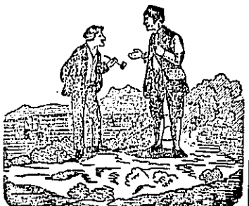
Franina i Jurina.

U zapadnoj Aziji u kraljevstvu Korea nastaj je krvava buna. U toj bijaše što protjerano što poubijano šest ministrah, dapače i jedan kraljev sin.