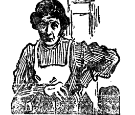
Le donne non dovrebbero portare mai di schiena, d'ori ai lombi e ai fianchi, mai di tasto, vertigini e languori.

Cine Ideal «Grandi caccie in Africa» interessanti scene dal vero in 4 lunghi atti.