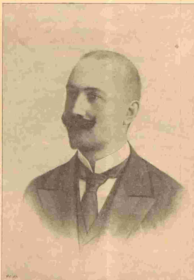
Prinz Konrad Hohenlohe

unter dessen Schutze weiter fortgedeihen zum Wohle des Reiches, des Landes, der Gemeinde und der Bevölkerung.