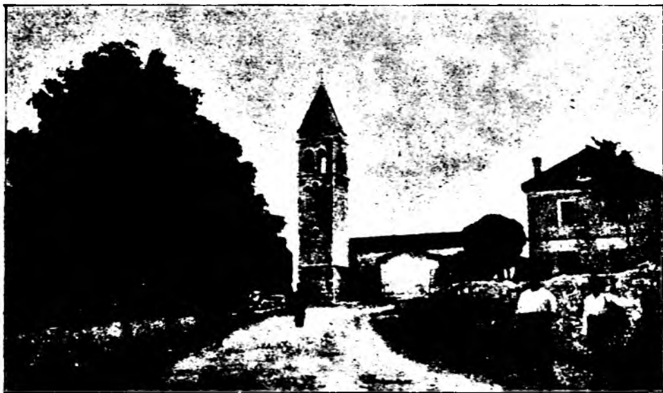
LIJEPA NAŠA ISTRA: Baderna kraj Poreča.