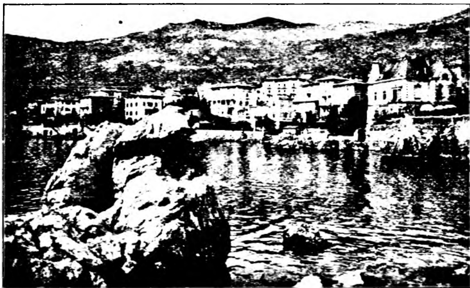
LIJEPA NAŠA ISTR: Lovrana.