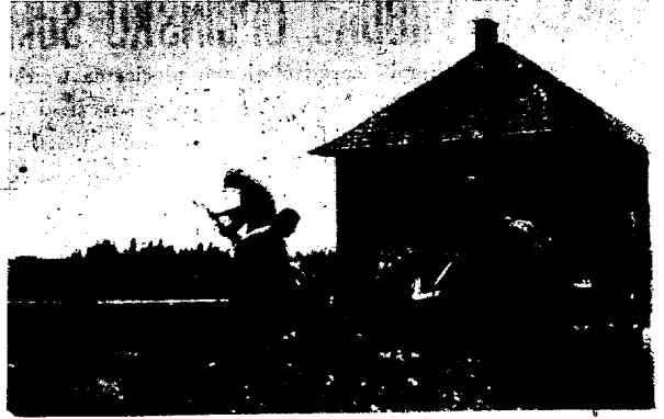
Begunci urejujejo svoj dom