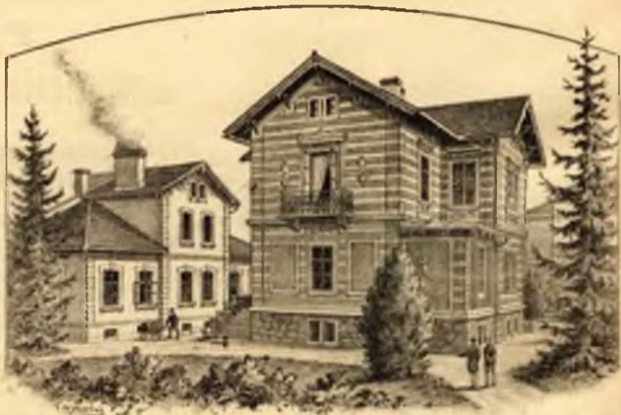
VEDUTA DEL LABORATORIO FARMACEUTICO