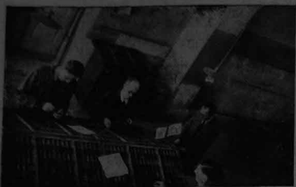
Queste due immagini rappresentano un caro ricordo fotografico di sei anni fa quando «L'Arena»...