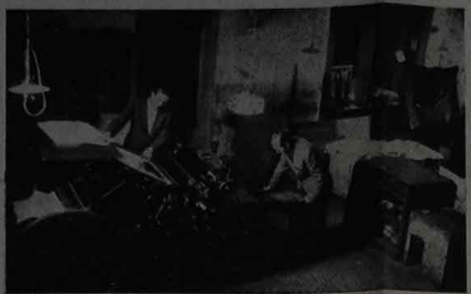
toro si lasciavano con la soddisfazione di un lavoro compiuto in unità d'intenti...