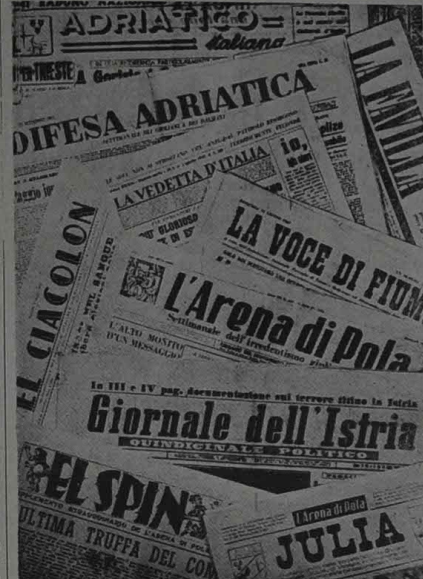
Numeri unici redatti con passione tradizionale, settimanali che lottano per una giusta causa e per vivere loro stessi, periodici che sono scoperti, testate famose...

italiana a Vienna, ma la Camera era aggiornata per l'ostrosuono slavo ed il problema rimaneva ancora insoluto.