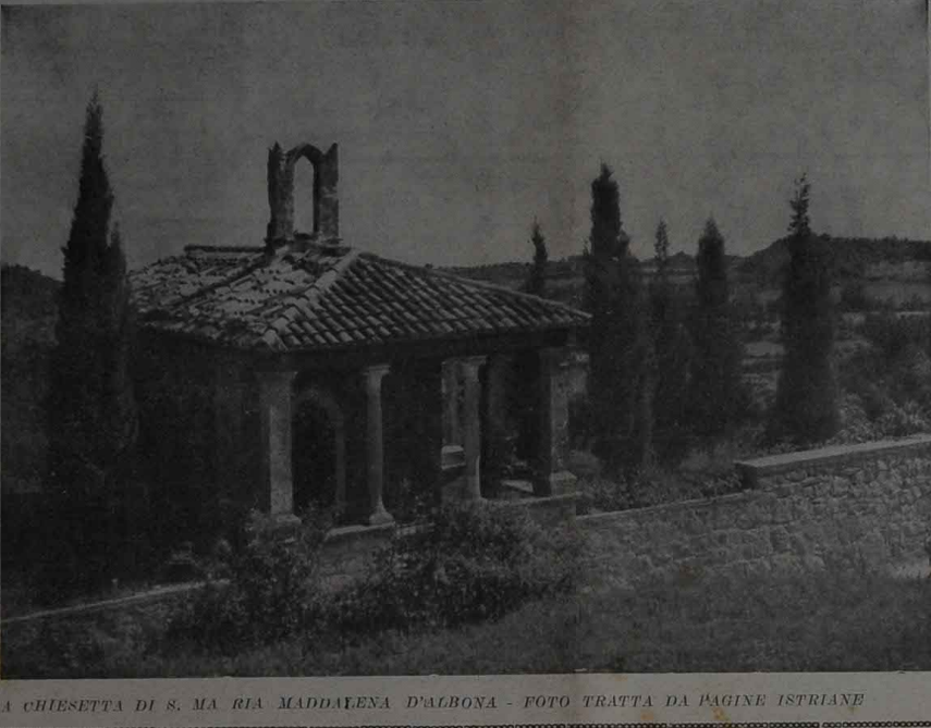
LA CHIESETTA DI S. MARIA MADDALENA D'ALBONA