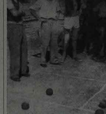
La Julia non dimentica i vecchi per i quali ha allestito un campo di bocce sul quale si svolgono accenti e combattute contese.