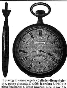
Is plavog ili crnog ocelja «Cylinder-Remontoir»-ura, posve plosnata f. 4-50; iz srebra f. 6-50; iz zlata fine konst. f. 28; sa brojčan. ploč. iz kov. f. 5